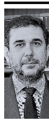
Του Σπύρου Βλαχόπουλου

Η επόμενη συνταγματική αναθεώρηση του 2008 ήταν περιορισμένης έκτασης και οδήγησε στην τροποποίηση τριών μόνο συνταγματικών διατάξεων, με κυριότερη από αυτές την κατάργηση του απόλυτου επαγγελματικού ασυμβίβαστου των βουλευτών που είχε θεσπιστεί το 2001. Η τελευταία συνταγματική αναθεώρηση του 2019 υπήρξε «σημειακή», επιχειρώντας να αντιμετωπίσει ορισμένες δυσλειτουργίες του πολιτεύματος. Έτσι και πέρα από τη διευκόλυνση σύστασης εξεταστικών επιτροπών από την αντιπολίτευση, η κυριότερη μεταβολή συνίσταται στην εκλογή του Προέδρου της Δημοκρατίας ακόμη και με απλή πλειοψηφία στη Βουλή, αποσυνδέοντας έτσι τη δια-