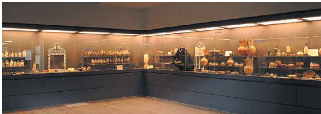
← Αίθουσα Ιωάννου Μαρτίνου