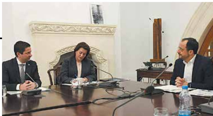
↑ Ο Πρύτανης του Πανεπιστημίου Αθηνών Γεράσιμος Σιάσος (αριστερά) συνομιλεί με την Υπουργό Παιδείας, Αθλητισμού και Νεολαίας της Κύπρου Αθηνά Μιχαηλίδου και τον Πρόεδρο της Κυπριακής Δημοκρατίας Νίκο Χριστοδουλίδη