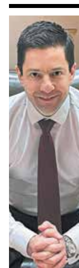
Του Γεράσιμου Σιάσου

Το Πανεπιστήμιο Αθηνών προσπλωμένο στις αρχές της αρίστης εκπαίδευσης, της προσφοράς νέας γνώσης, της διασύνδεσης με τα μεγαλύτερα παγκόσμια φόρα της γνώσης και της τεχνολογίας, θα συνεχίσει να λειτουργεί ως πνευματικός φάρος στην πατρίδα μας και ως πρεσβευτής του ελληνικού φωτός στον κόσμο. Μέσα σε αυτό το διάχυτο κλίμα χαμηλής εμπιστοσύνης στους θεσμούς, η εμπιστοσύνη των πολιτών στο Πανεπιστήμιο μας γεμίζει με σεβασμό, υποχρέωση και ευθύνη. Υποχρέωση και ευθύνη γιατί η υπεράσπιση των θεμελιωδών θεσμών της δημοκρατίας μας και η εμπιστοσύνη των πολιτών σε αυτούς είναι ένας διαρκής αγώνας δημοκρατίας. Στον αγώνα αυτόν το Πανεπιστήμιο Αθηνών από την ίδρυσή του μέχρι σήμερα παραμένει στην πρώτη γραμμή.