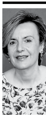
Της Ευαγγελίας Χαρμανδάρη

Καθηγήτριας Παιδιατρικής - Παιδιατρικής Ενδοκρινολογίας στην Ιατρική Σχολή του Πανεπιστημίου Αθηνών και Προέδρου της Ελληνικής Εταιρείας Παιδιατρικής και Εφηβικής Ενδοκρινολογίας, Μεταβολισμού και Σακχαρώδους Διαβήτη