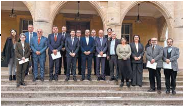
↑ Η πολιτική ηγεσία της Κύπρου και τα μέλη της αντιπροσωπείας του Πανεπιστημίου Αθηνών κατά την πρόσφατη επίσκεψή τους στο νησί