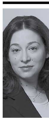
Της Βασιλικής Χρήστου

Κοντολογίς, στο μέλλον πρέπει να αντιμετωπίσουμε με λιγότερο φοβικό τρόπο το βασικό διαβουλευτικό όργανο του πολιτεύματος, τη Βουλή. Ο καλύτερος τρόπος για να προστατευθεί η δημοκρατία μας στον, όπως αναδεικνύεται, μακρύ εικοστό πρώτο αιώνα που έχουμε μπροστά μας, είναι η περισσότερη δημοκρατία.